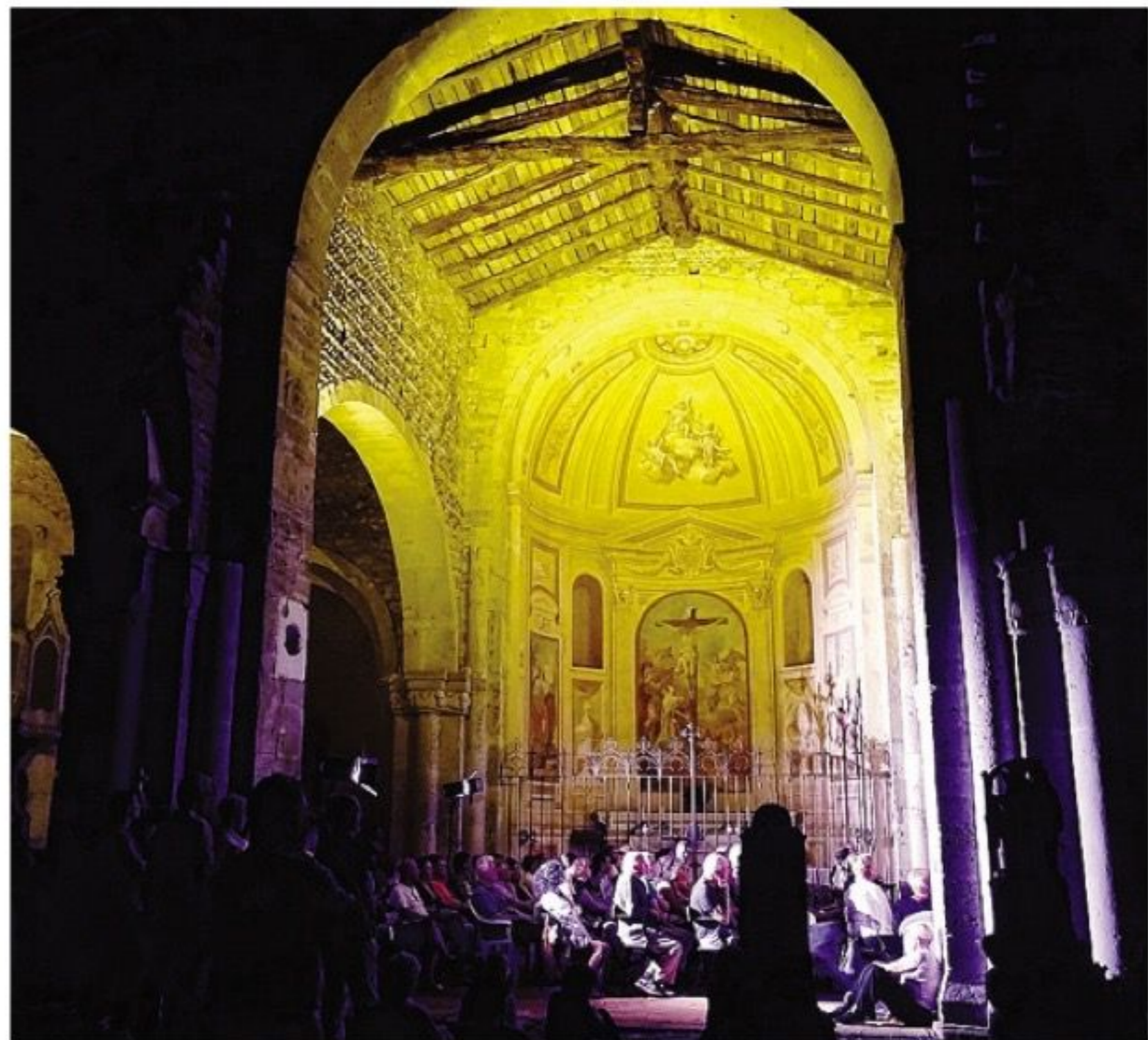
La basilica di Santa Giulia a Bonate Sotto, una delle testimonianze romaniche più significative in Lombardia